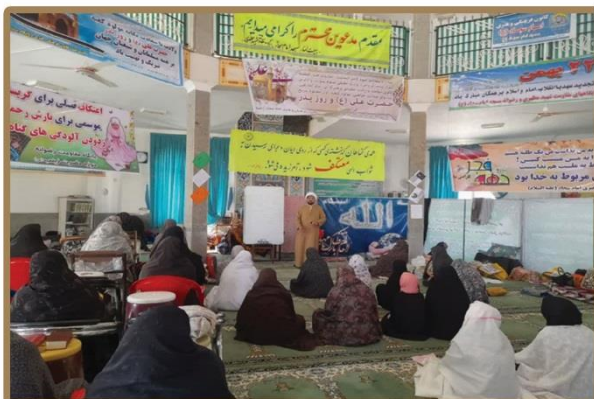
برگزاری نشست های نمازشناسی ویژه هزار و ۲۲۵ معتکف در خراسان رضوی