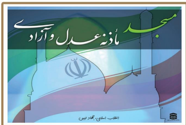
در راستای رهنمودهای رهبر معظم انقلاب اسلامی بر جهان تبیین در دهه مبارک فجر انقلاب اسلامی مسابقه مسجد، مأذنه عدل و آزادی با شرکت ۲۰ هزار نفری برگزار شد