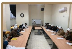
اولین جلسه دوره آموزشی جدید جهت تربیت مدرس نماز در مرکز تخصصی نماز مشهد برگزار شد