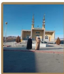
از مساجد بین راهی محورهای مواصلاتی به مشهد مقدس بازدید شد