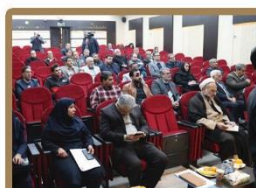
هم اندیشی مسئولان دستگاه های اجرایی استان با مدیران مجتمع های خدمات رفاهی بین راهی