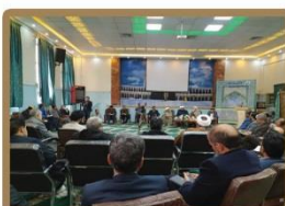
جلسه شورای عالی اقامه نماز آموزش و پرورش خراسان رضوی برگزار شد کارگاه آموزشی احکام نماز بیماران ویژه بیمارستان امام حسین تربت حیدریه برگزار گردید